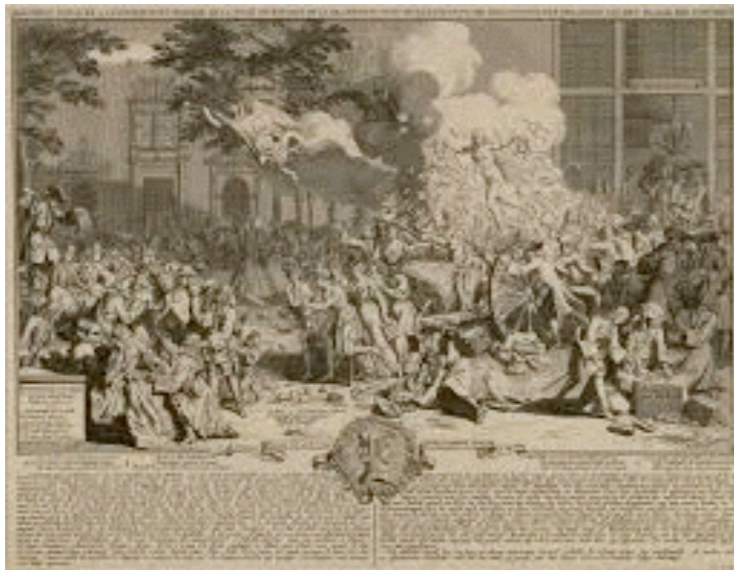
la fin du Système de Law

1719 -début de la guerre entre la France et l'Espagne. mai : création par Law de la Compagnie des Indes Orientales.