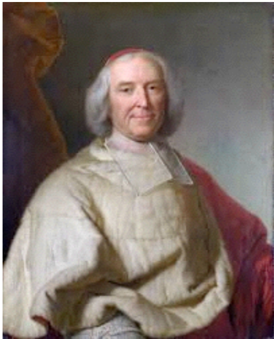
le cardinal de Fleury