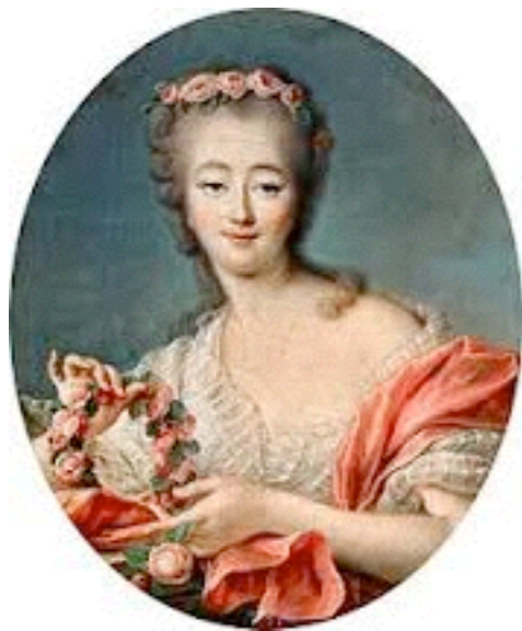
Madame du Barry

apparenté à la plupart des grandes familles de robe, il est président au Parlement de Paris(1737), puis premier président de ce Parlement (1763). Protégé par Madame du Barry, il est nommé chancelier de France en 1768 par Louis XV, décidé à briser l'opposition parlementaire après l'affaire de Bretagne. Opposé à la politique extérieure de Choiseul, il contribue à la disgrâce du ministre en 1770. Le 6 juin 1771, il forme avec d'Aiguillon et Terray un triumvirat antiparlementaire. Après avoir exilé les parlementaires, dans la nuit du 19 au 20 janvier 1771, il entame une profonde réforme judiciaire par l'Edit du 23 février 1771 (abolition de la vénalité des charges), création d'un nouveau Parlement de Paris formé de juges appointés révocables. Malgré le discrédit jeté par le noblesse et les salons sur le «Parlement Maupéou», les nouveaux tribunaux fonctionnent de façon satisfaisante. Mais l'oeuvre de Maupéou est détruite par Louis XVI et le ministre est disgracié par le roi.