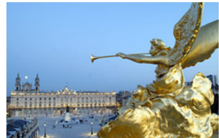
Place Stanislas à Nancy