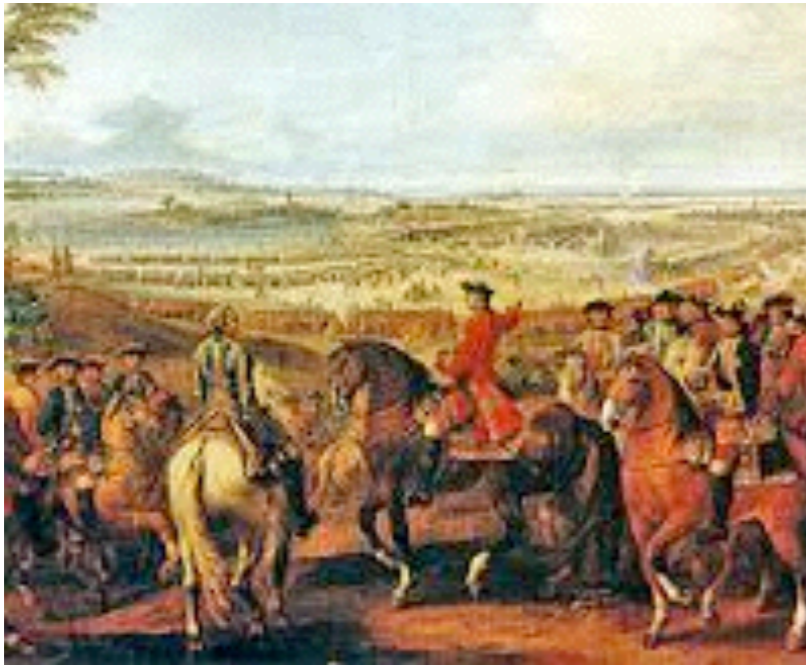
la Guerre de Succession d'Autriche