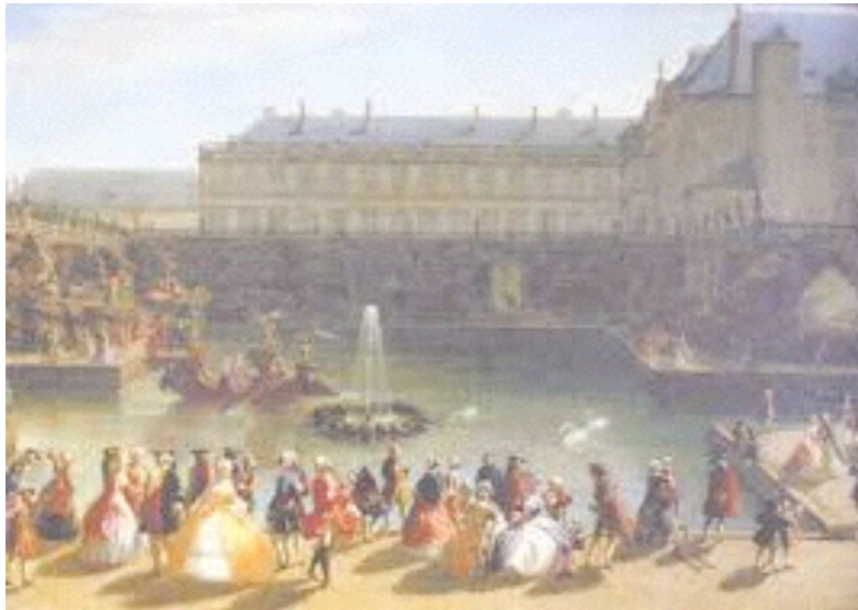
la Lorraine devient française