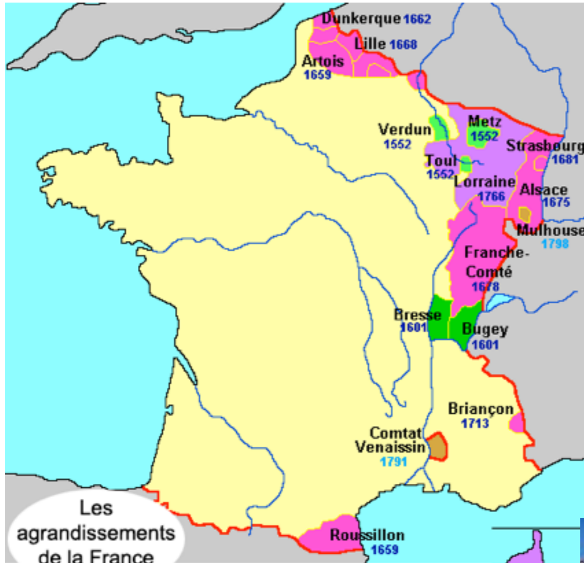
Les agrandissements de la France