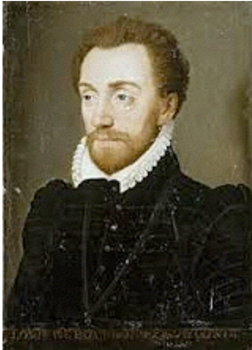
le duc de Bourbon

Le duc de Bourbon Louis Henri de Condé, ( Versailles 1692 - Chantilly 1740)