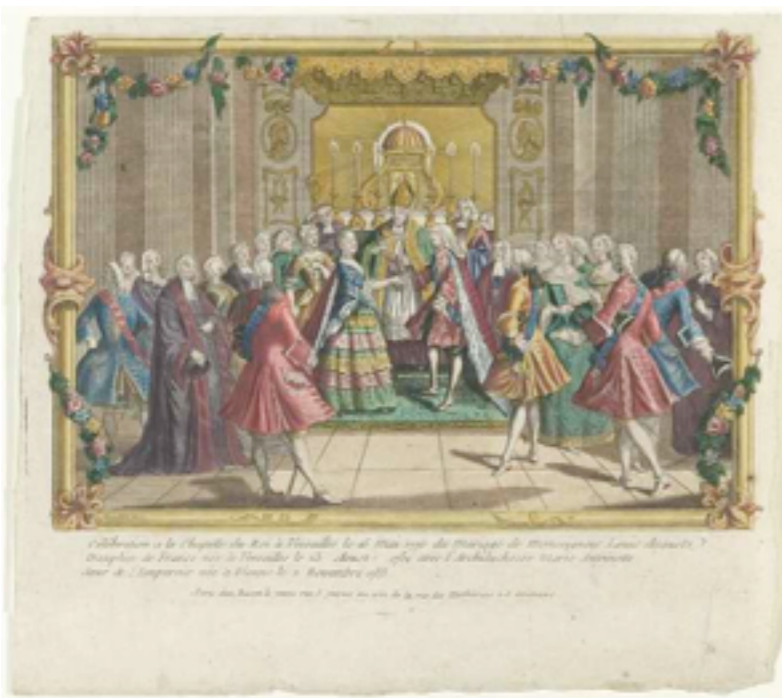
le mariage du futur Louis XVI

1766- mort de Stanislas Leszczynski, la Lorraine devient française