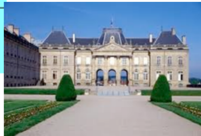
Château de Lunéville

1766: à sa mort, la Lorraine devient française.