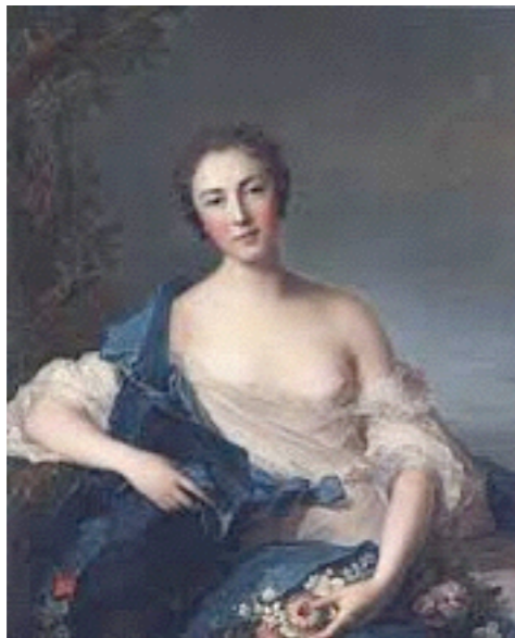
une des soeurs de Nesle

1724 -18 juillet : fondation de la Bourse de Paris.