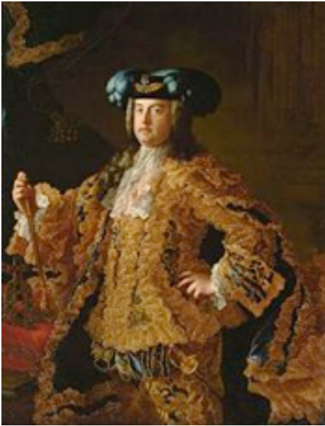
François 1er du Saint-Empire

La France n'a rien gagné, elle en sort affaiblie. Elle est fâchée avec la Prusse et l'Autriche, sous tension avec la Grande-Bretagne et en position de faiblesse par rapport à l'Espagne.