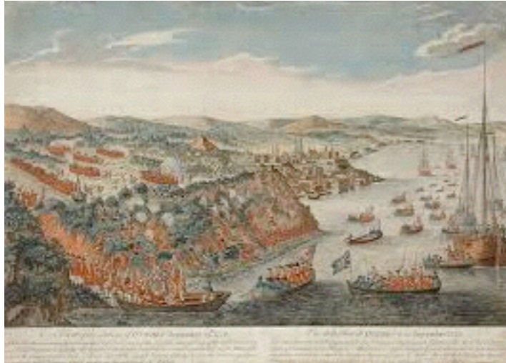
la prise de Québec