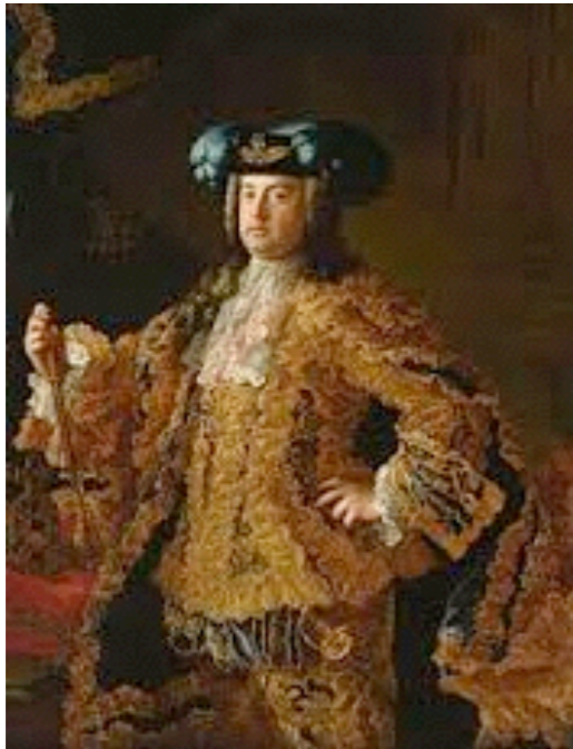
François III de Lorraine