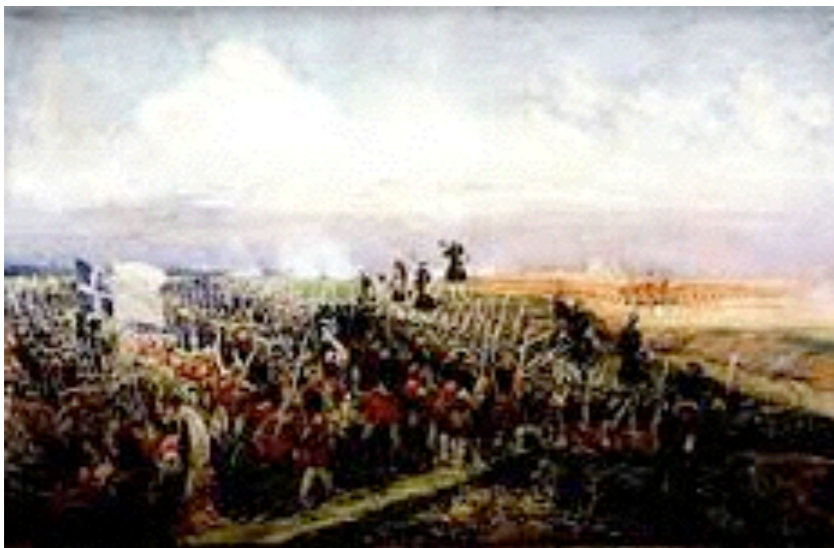
la bataille de Fontenoy