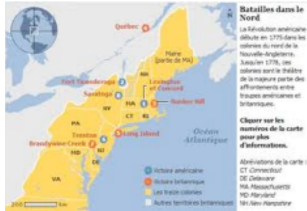
Les 13 colonies