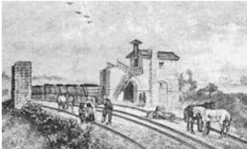
les premières lignes de chemin de fer