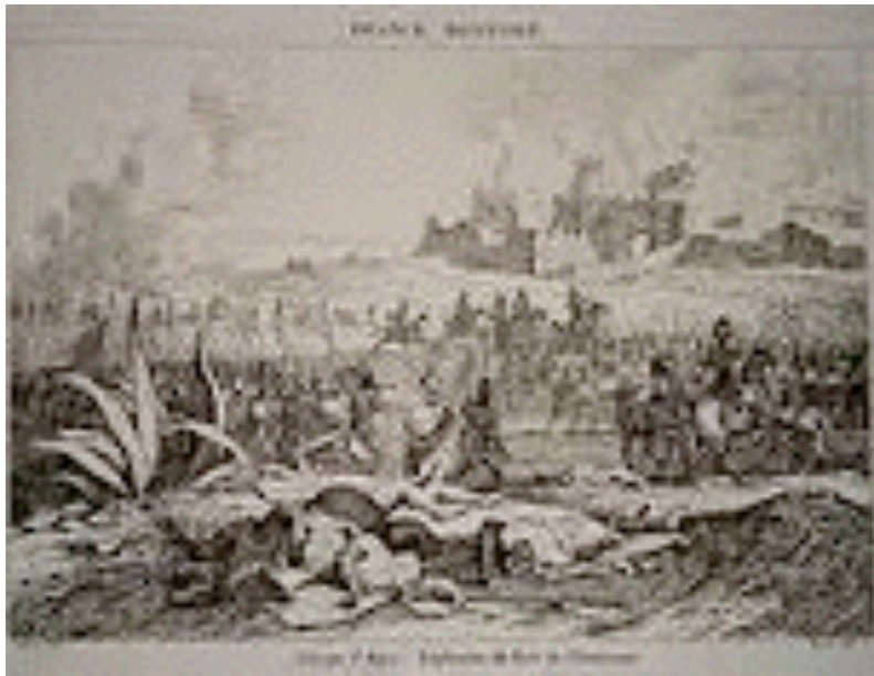
la prise d'Alger