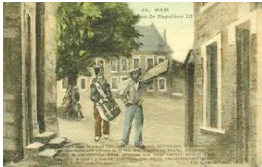
l'évasion de Louis-Napoléon Bonaparte

1842 : loi concédant la gestion de diverses lignes de chemin de fer à des compagnies privées.