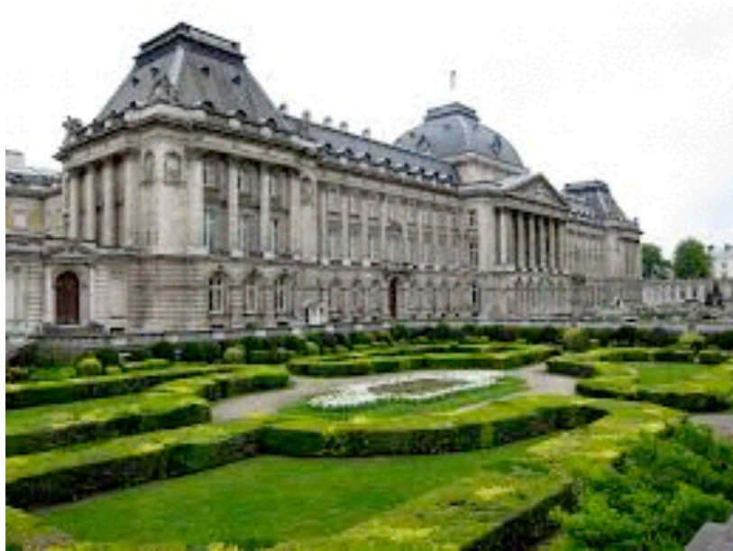
le Palais Royal