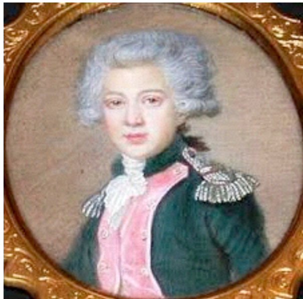
le duc de Chartres

1817 -mi-Avril retour au Palais Royal. Il aura, en fait, 4 résidences : le château de Neuilly, le château d'Eu en Seine-Maritime (hérité de son grand-père maternel) et le domaine de Randan entre Vichy et Clermont-Ferrand (qui appartenait à sa soeur Marie-Adélaïde).