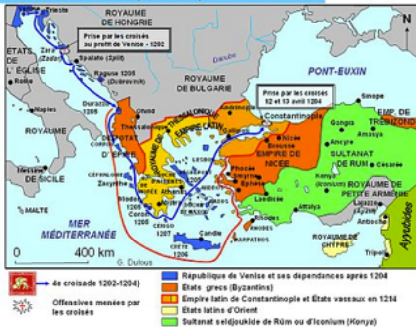
LA QUATRIÈME CROISADE (1202-1204)

Cette croisade a permis la reprise d'un certain nombre de ports de Terre sainte, mais n'a pas permis la reconquête de l'espace palestinien, ni la reprise de Jérusalem. Cependant, la libre circulation à Jérusalem est autorisée aux pèlerins et aux marchands chrétiens.