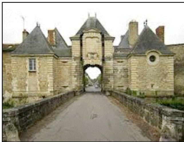
la ville de Richelieu

Richelieu: Armand Jean du Plessis, cardinal, duc de Richelieu(Paris 1585- Paris 1642).