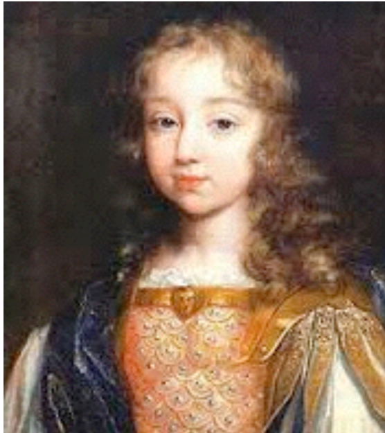
Louis XIV enfant

1642-13 juillet : mort de Marie de Médicis à Cologne.