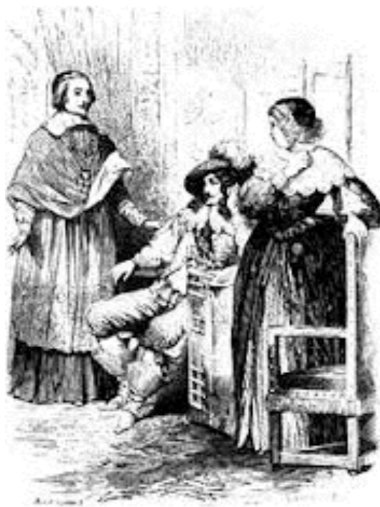
la Journée des Dupes