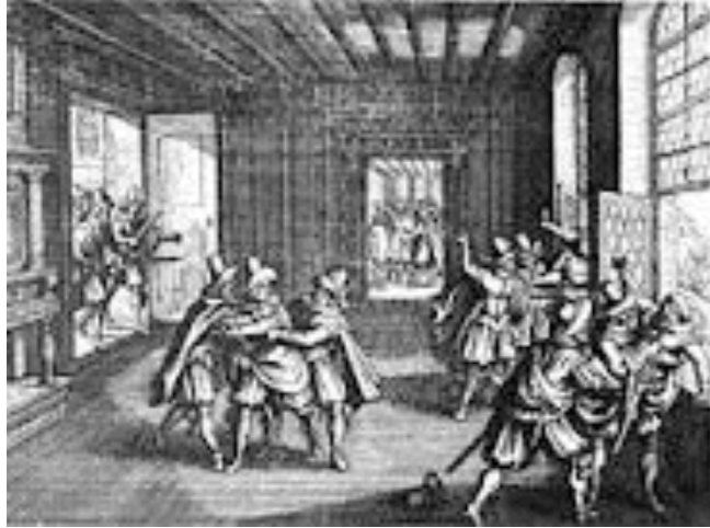
la défenestration de Prague