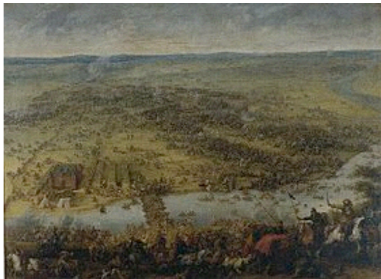
Bataille de Thionville (1639)

1635 -la France déclare la guerre à l'Espagne et fait face à deux rois catholiques Habsbourg: Ferdinand III du Saint-Empire et Philippe IV d'Espagne (renseigné en secret par sa soeur Anne d'Autriche). Louis XIII s'allie à la Suède et aux princes réformés allemands. Début de la Guerre de Dix Ans en Franche-Comté.