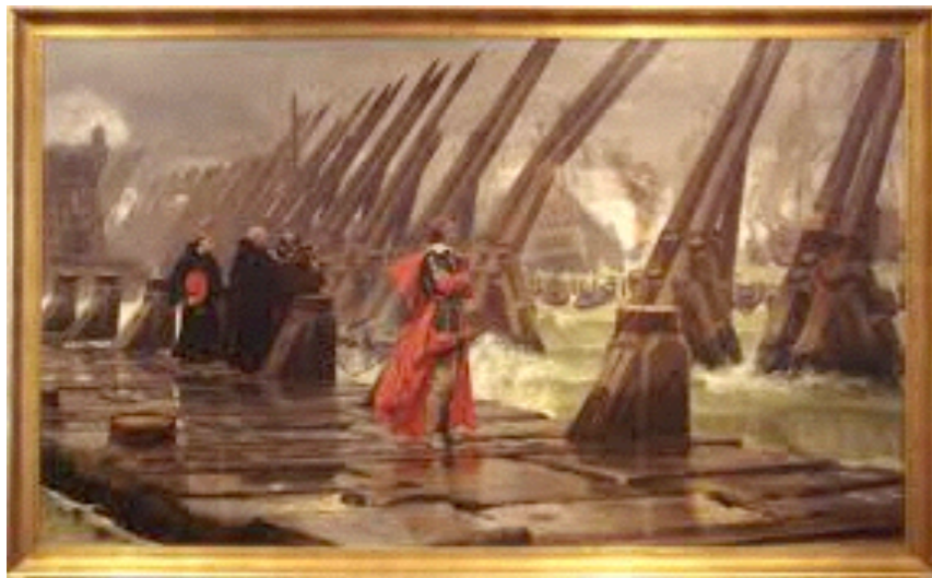
Le siège de La Rochelle

Le complot est déjoué le 11 mai 1626. Chalais est exécuté, les autres conjurés sont emprisonnés, mais Gaston d'Orléans est pardonné.