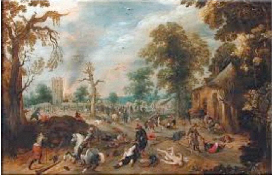
La Guerre de dix ans