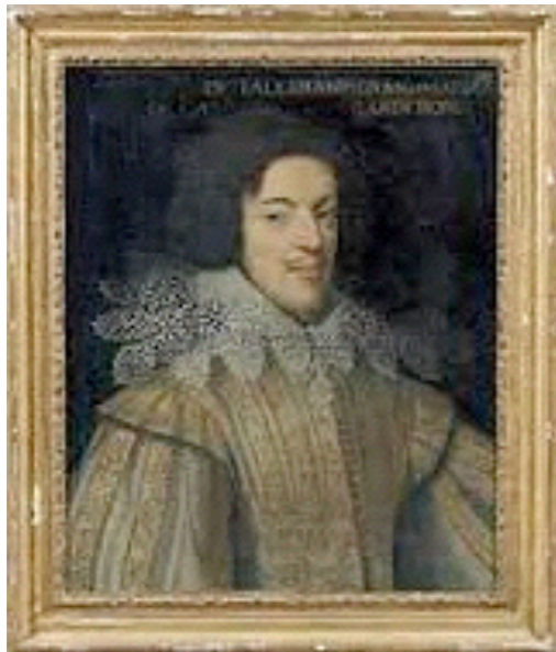
Le comte de Chalais