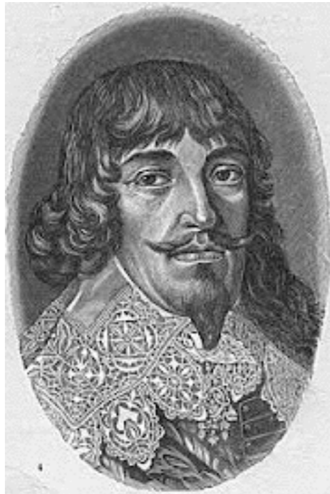
Bernard de Saxe-Weimar