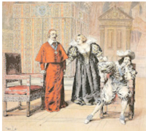
la Journée des Dupes

1626 -Paix de Paris avec les protestants. Conspiration de Chalais : le but était d'assassiner Richelieu et peut-être même le roi pour le remplacer par Gaston de France , frère du roi. Henri de Talleyrand-Périgord, comte de Chalais fut décapité.