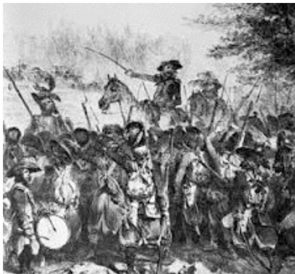
la bataille des Ponts-de-Cé