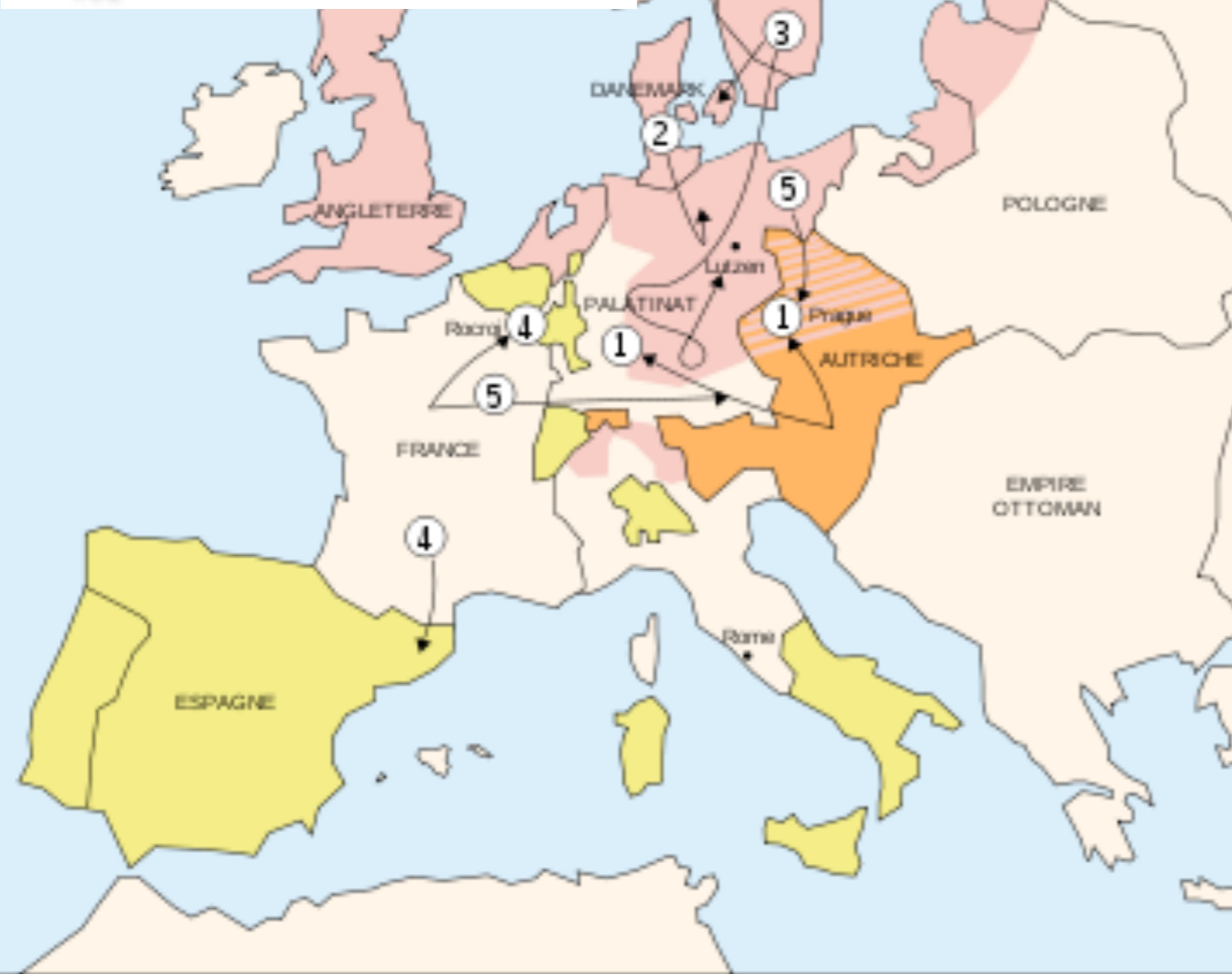
LA GUERRE DE TRENTE ANS