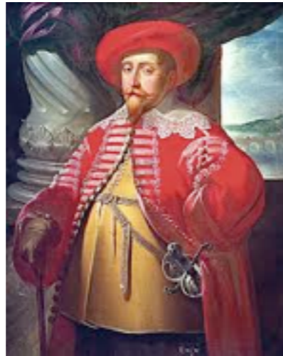
Gustave II Adolphe