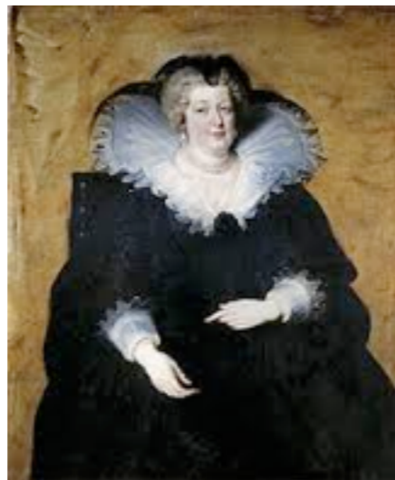
Marie de Médicis