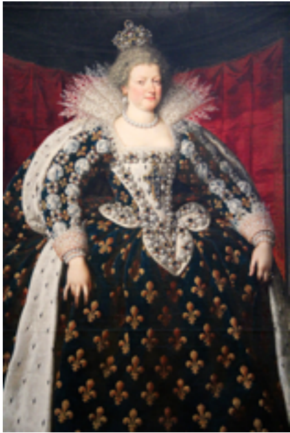
Marie de Médicis